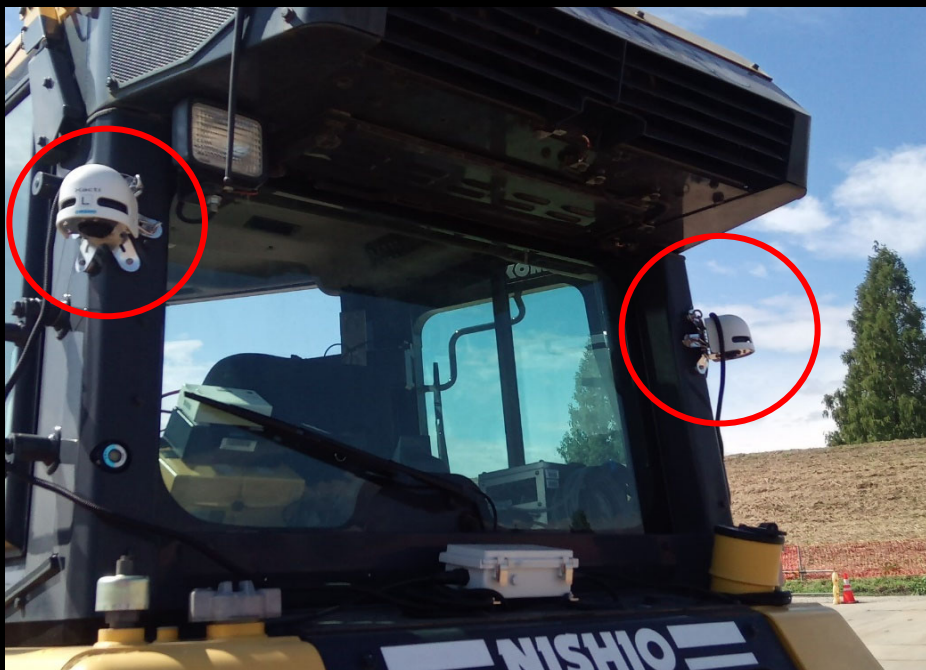
重機への取り付け状況