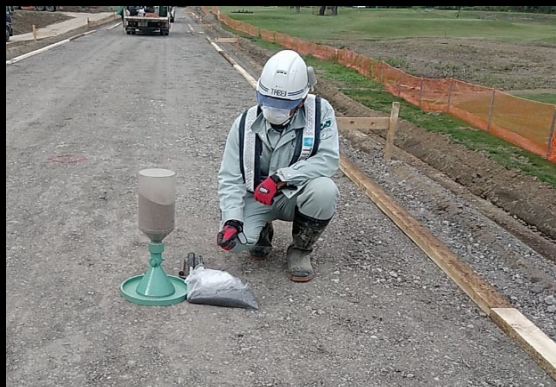
品質管理（現場密度試験）